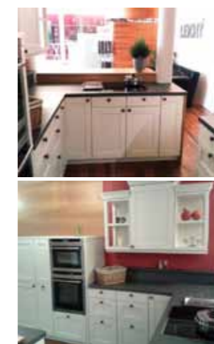
Bringen Sie Ihre Raummaße mit!

In einer Landhausküche klingt vieles an: Genussfreude, Lebensart, der Wunsch nach Einfachheit und Reduktion, unabhängig von schnelllebigen Trends. Entdecken Sie ein neues Lebensgefühl. Die Natürlichkeit ist nicht nur das Beste, sondern auch das Vornehmste.