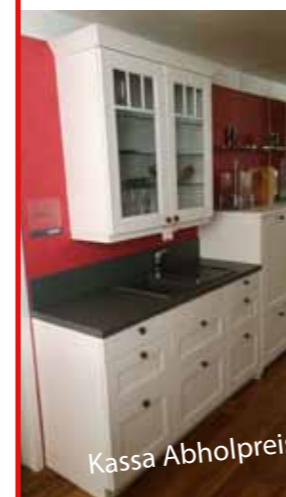
Kassa Abholpreis Auf Wunsch montieren wir auch Ihre Landhausküche.